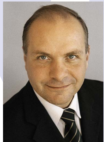
Forsvarsminister Søren Gade

Jeg håber I er klar igen til næste år. Hvor talerne vil