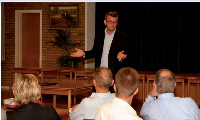
Miljøminister Troels Lund Poulsen var taler ved EU-mødet i Vordingborg