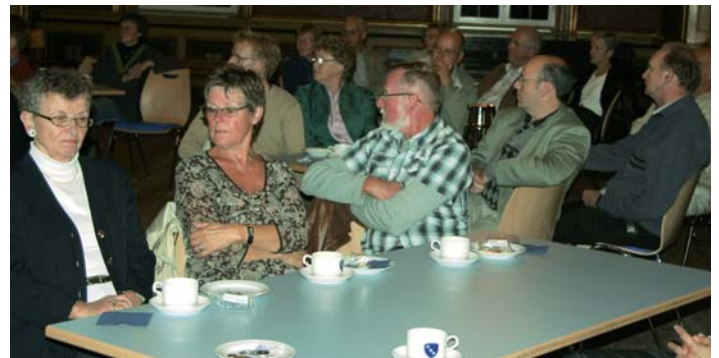
Situation fra mødet på Herlufsholm.