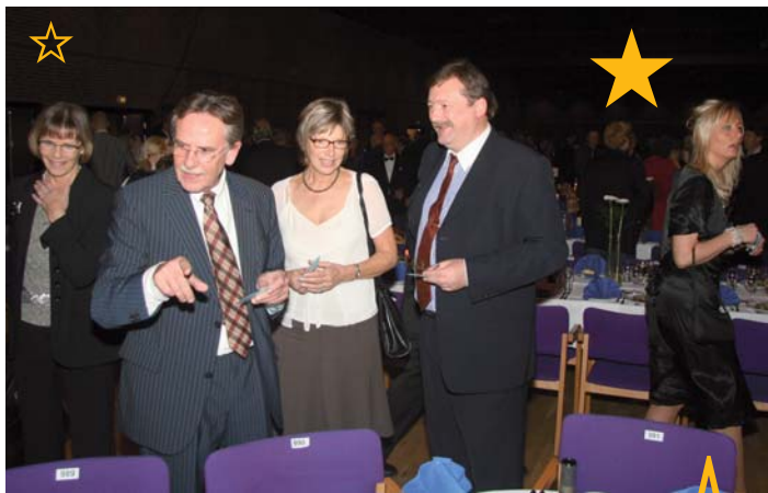
Situationer fra landsmødet.