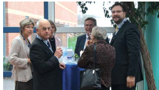
Situationer fra landsmødet.