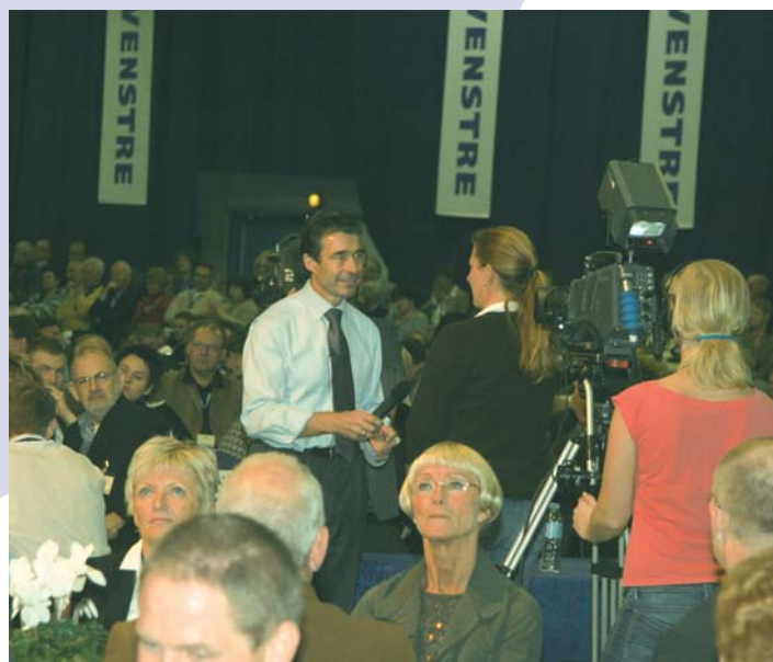
Statsminister Anders Fogh Rasmussen kunne som sædvanlig begejstre alle gæster på Landsmødet