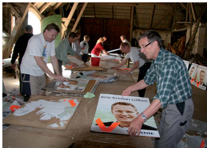
Der klister plakater til EU-valget

eller bestyrelserne ikke klare alene. Vi skal bruge alle de kompetencer, som vore medlemmer har, så derfor skal jeg på denne plads opfordre alle, som gerne vil være med til at sikre, at vi ved valget får ændret på styrkeforholdet i byrådet, til at rette henvendelse til mig eller jeres lokale vælgerforenings formand. Opgaven går i al sin enkelhed ud på, at vi punkt for punkt skal forklare vælgerne, hvordan Venstre vil styre Næstved Kommune, og hvordan vi atter får økonomien i kommunen til at hænge sammen. Vi skal fortælle, hvordan vi alle igen bliver stolte af vores kommune, så det bliver tiltrækkende for nye borgere og nye virksomheder at flytte hertil.