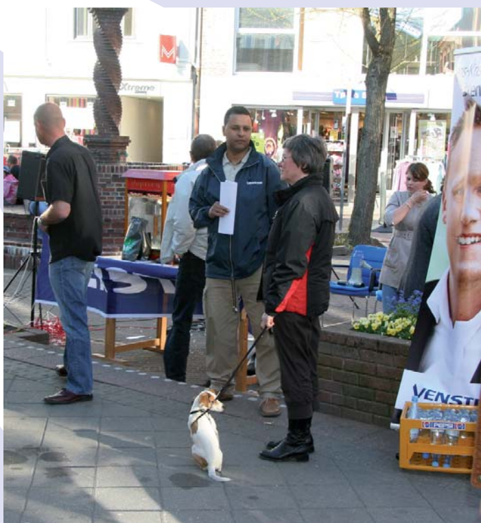
Venstre var også til "City Night"