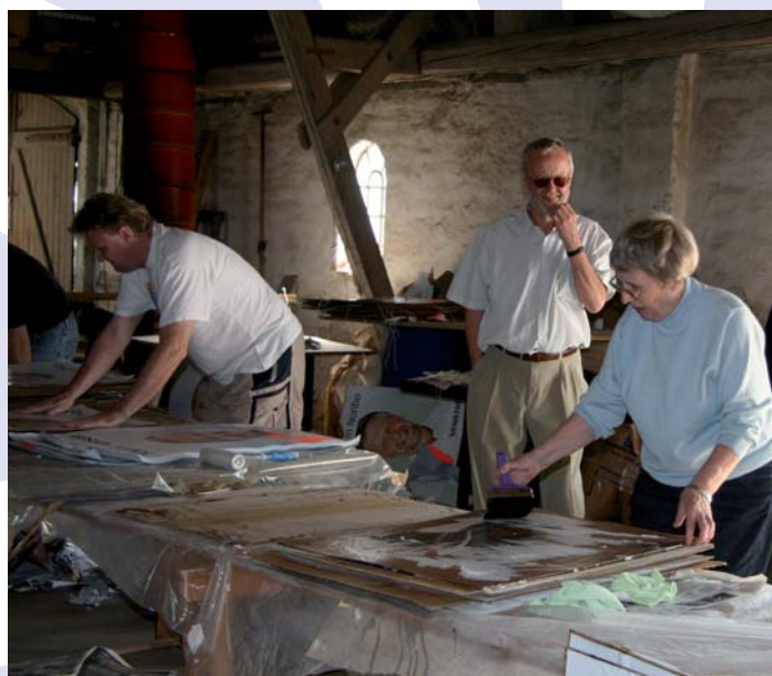
Der klister plakater til EU-valget

Program samt pris foreligger i juni måned. Elmer Jacobsen tlf. 55 44 40 54 Mob. 21 45 51 07.