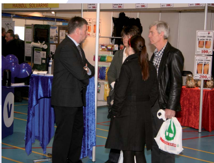
Venstre havde sin egen stand på messen i Næstved Hallerne

Der er også tid til at more sig når venstre holder bestyrelsesmøder