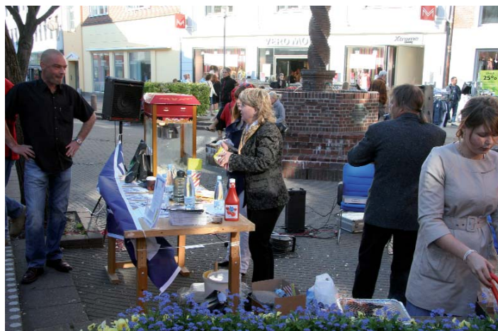
Stemning fra "City Night"