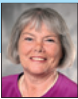
Af Kirsten Devantier