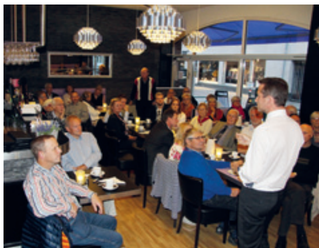
Stemning fra mødet på Café 31