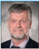
Af Karsten Nonbo