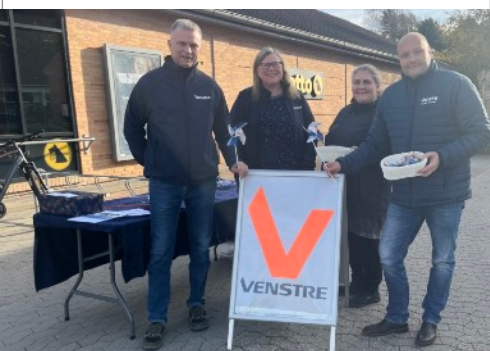
På jagt efter borgere og deres meninger og ideer foran Netto i Mogenstrup.