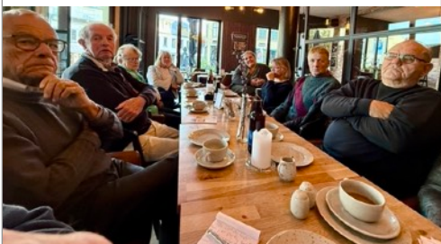
Morgenmøde i "klubcafeen," Cafe Oliver midt i Næstved.